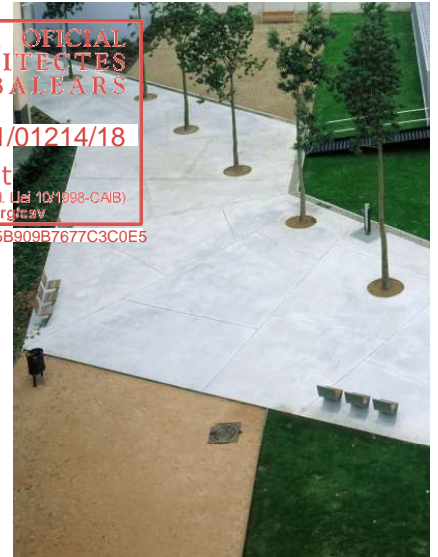
IMAGEN DE REFERENCIA DE LA PARTIDA: D1601.0071