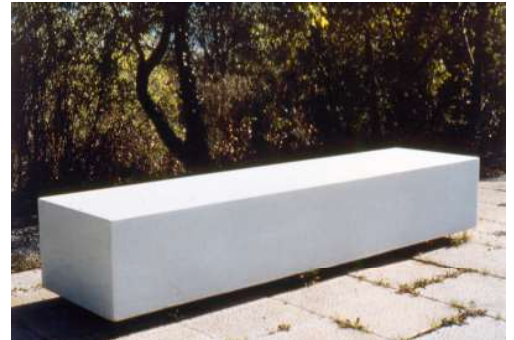
IMAGEN DE REFERENCIA DE LA PARTIDA: D2602.0010