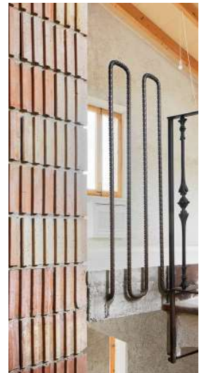
IMAGEN DE REFERENCIA DE LA PARTIDA: D2406.0020