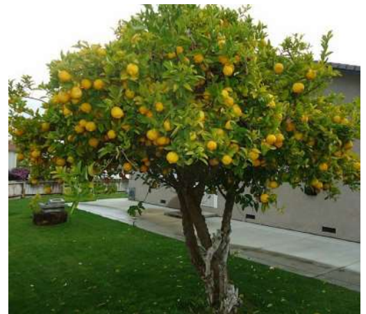
IMAGEN DE REFERENCIA DE LA PARTIDA: D2517.0013

Pirámider Tropa A250 (380 D, el columpio)