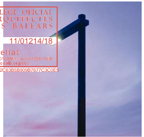
IMAGEN DE REFERENCIA DE LA PARTIDA: D2517.0011