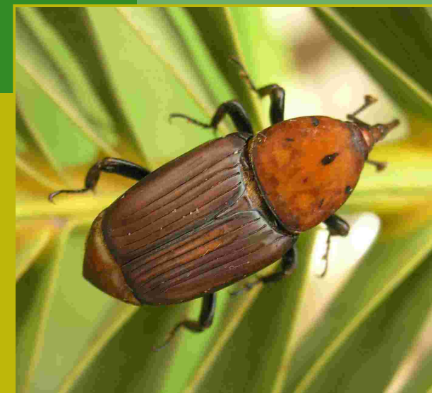
[ Rhynchophorus ferrugineus ]