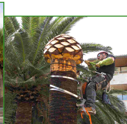
Tècnica de sanejament